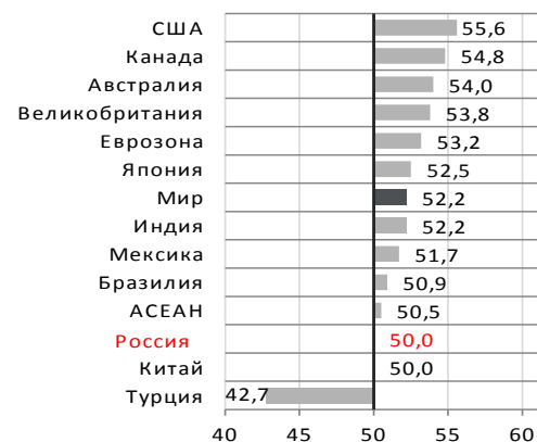
Индексы PMI обрабатывающих отраслей промышленности в некоторых странах и регионах мира в сентябре 2018 г.

Примечание: показатель PMI выше 50 указывает на рост, ниже – на падение деловой активности