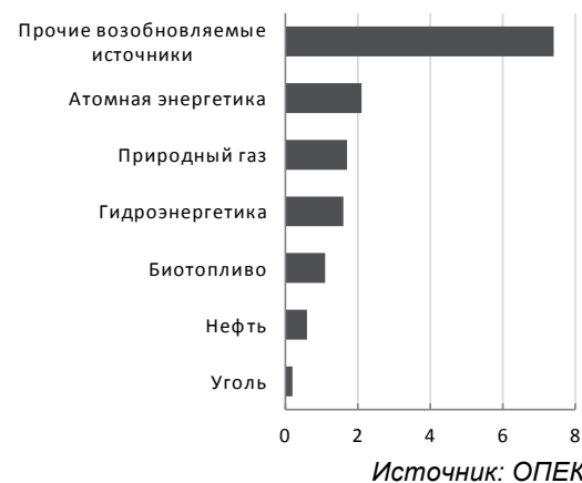
Среднегодовые темпы роста спроса на энергию по типам источников в 2015-2040 гг., %